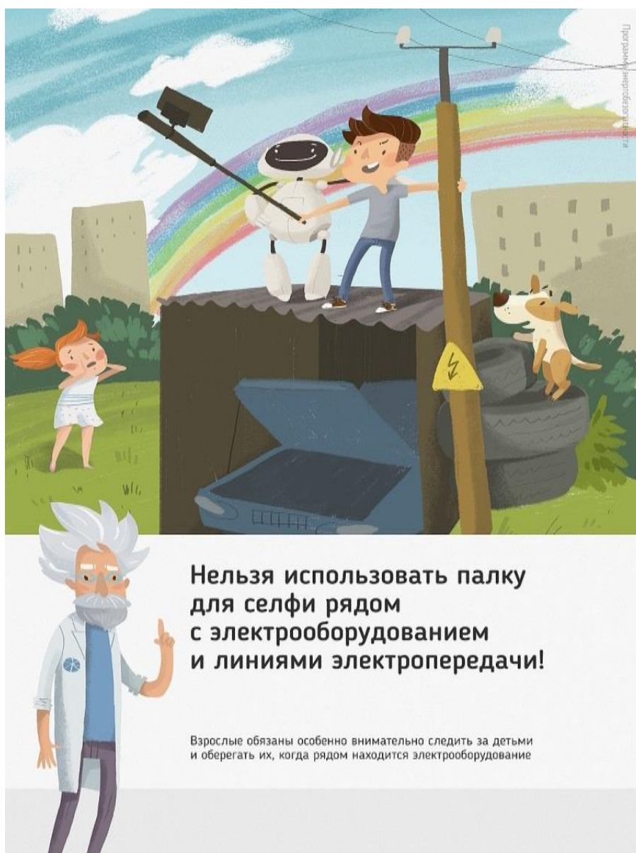
Рис 2. Нельзя использовать палку для селфи рядом с электрооборудованием и линиями электропередачи

Ну и, наконец, нужно повторить с ребенком алгоритм действий в экстремальной ситуации. Проверьте, умеет ли он набирать на сотовом телефоне телефон экстренных служб. Изучите с ним вещества и предметы, которые хорошо проводят электрический ток и потому особенно опасны, и, наоборот, вещества и предметы, плохо проводящие электрический ток и полезные в экстремальной ситуации.