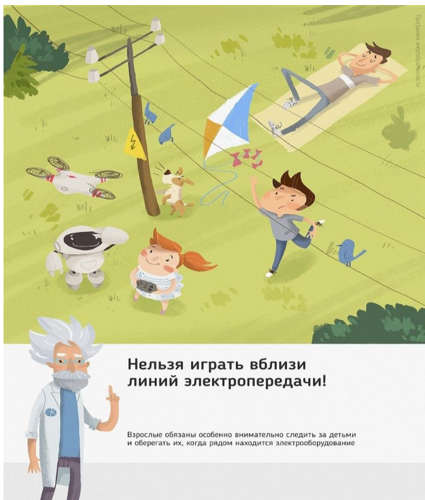
Рис.3 Нельзя играть вблизи линий электропередачи