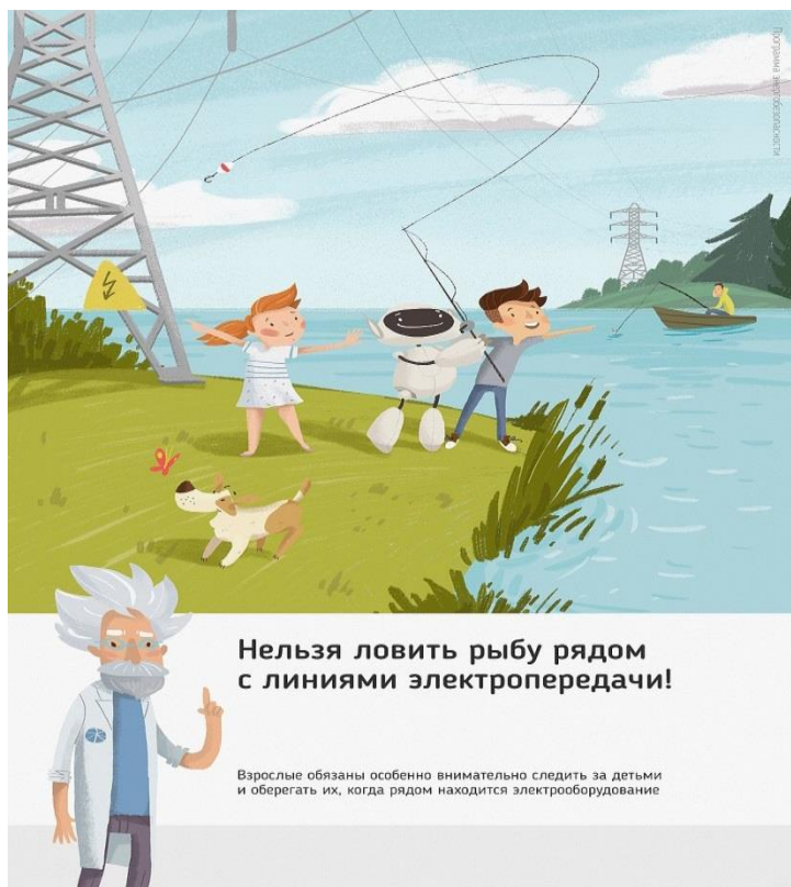
Рис. 4 Нельзя ловить рыбу рядом с линиями электропередачи

Об открытых подстанциях, оборванных проводах нужно сообщить в Кубанское ПМЭС по телефону 8-861-219-40-20 или позвонить на единый телефон всех экстренных служб 112.