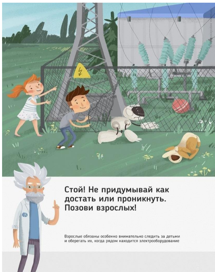
Рис. 5 Стой! Не придумывай как достать или проникнуть. Позови взрослых!